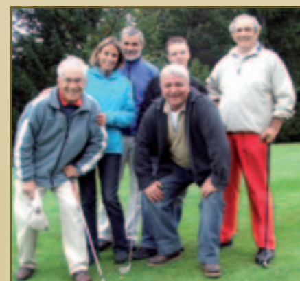
La bonne humeur est toujours de mise

Au delà du ludique proprement dit, l'objectif de ce groupe toujours croissant d'amis, possédant une complémentarité professionnelle évidente, est de fortifier leur relationnel dans le cadre d'une journée "entreprises". Et la "mayonnaise" prend chaque fois d'autant mieux que ce rendez-vous mitonné en amont est, depuis longtemps, consolidé par une soirée et un dîner, la veille (1). Histoire d'apprendre à mieux se connaître et installer un dialogue.