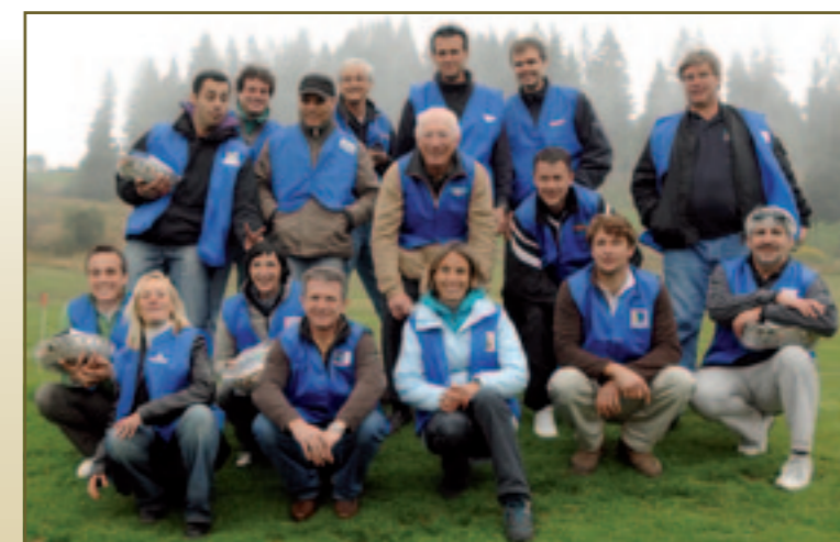
Le groupe des Technologues s'est étoffé au fil du temps