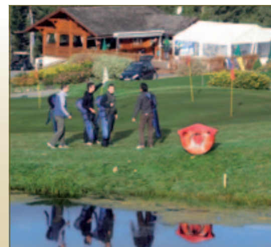
En route pour un bout d'aventure en direction des sommets des Gets